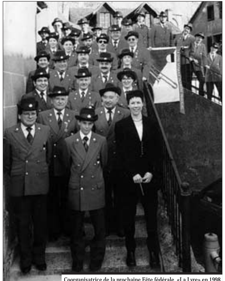
Coorganisatrice de la prochaine Fête fédérale, «La Lyre» en 1998, à l'occasion de son 75 e anniversaire.