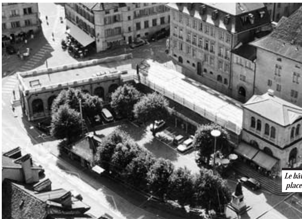
Le bâtiment des Arcades, place des Ormeaux.