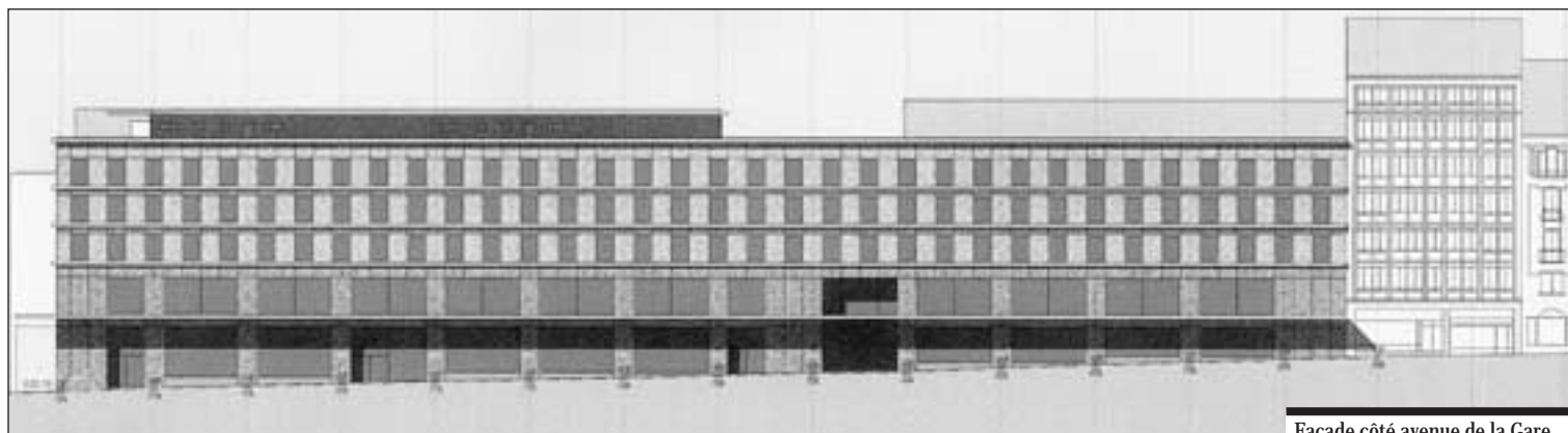
Façade côté avenue de la Gare.

L'ensemble construit représente environ 150 000 m 3 SIA, comptant 28 000 m 2 de surface brute de plancher sur 7 niveaux hors terre et 6 sous terre, répartis en locaux commerciaux, administratifs, en habitation, en dépôts et en parking, conformément au plan d'aménagement de détail et au permis de construire. L'achèvement de cet ensemble immobilier est envisagé dans le courant de l'année 2003.