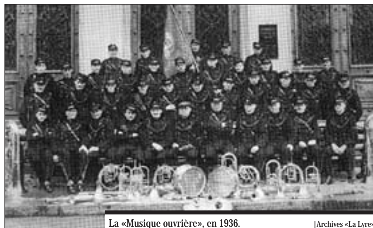
La «Musique ouvrière», en 1936.