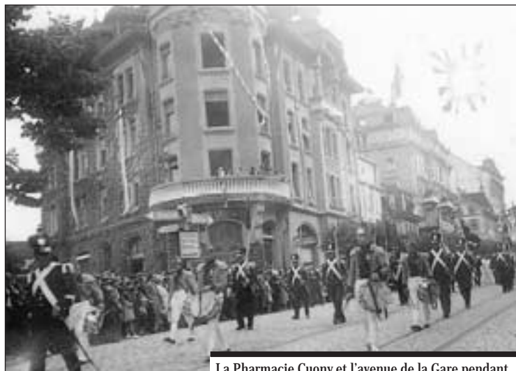
La Pharmacie Cuony et l'avenue de la Gare pendant le cortège du Tir fédéral de 1934.

Dix propriétaires étaient concernés par des parcelles réparties géographiquement en deux secteurs : le secteur A et C et le secteur B. Elles ont fait l'objet d'un plan d'aménagement de détail (PAD) qui, en vertu de la loi du 9 mai 1983 sur l'aménagement du territoire et les constructions (LATeC), devait nécessairement compléter le plan d'aménagement