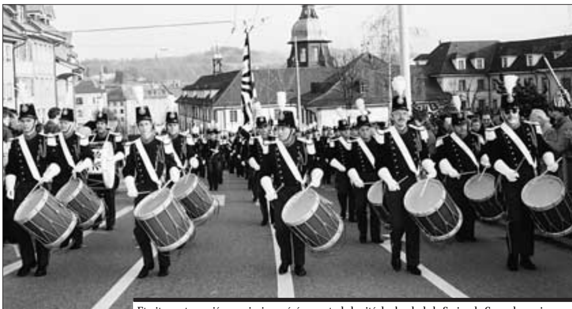
Etroitement associé aux principaux événements de la cité des bords de la Sarine, le Corps de musique officiel de l'Etat et de la Ville de Fribourg défilant à la rue de l'Hôpital.