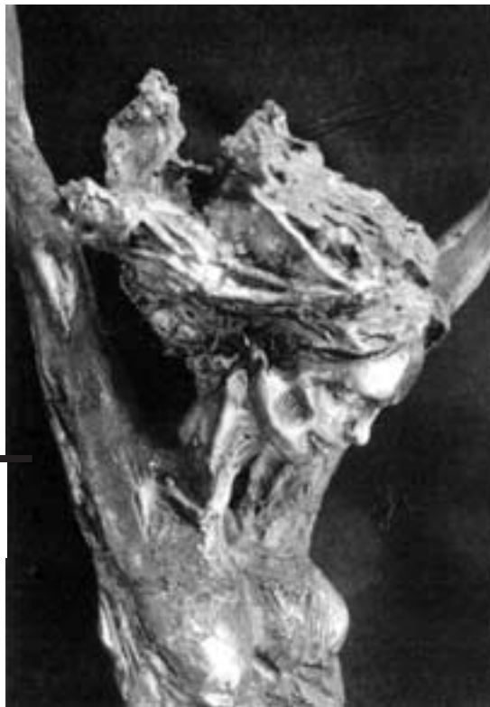
L'une des sculptures en bronze de Nuccio Fontanella.

• Nuccio Fontanella sculptures, du 2 au 30 juin; Galerie de la Cathédrale, place Saint-Nicolas.