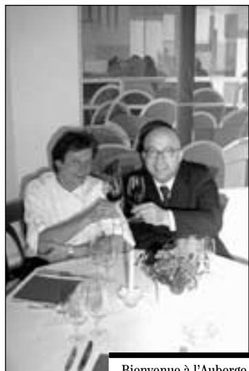
Bienvenue à l'Auberge de Zaehringen.

Les murs de l'auberge accueillent régulièrement des ta-