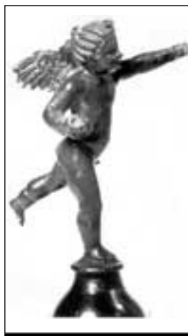
Amor ou la version romaine du messager de l' Amour , II e siècle après J.-C.

Musée d'art et d'histoire (MAHF), rue de Morat 12, 1700 Fribourg.