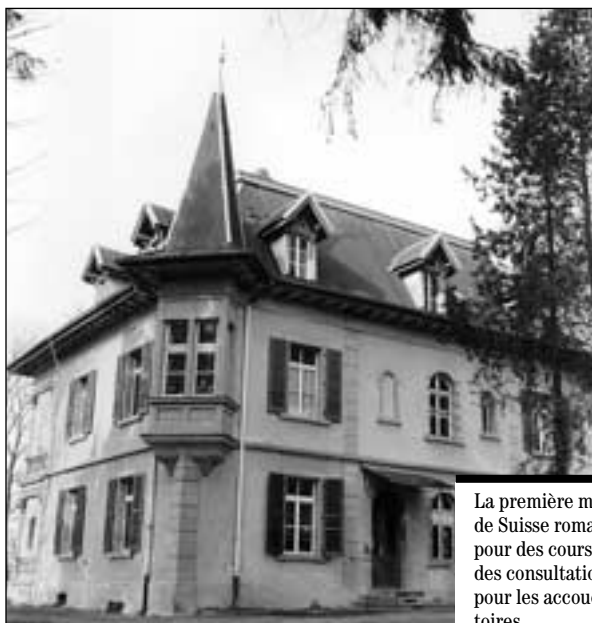
La première maison de naissance de Suisse romande offre 5 pièces pour des cours de préparation, des consultations prénatales et pour les accouchements ambulatoires.

Vor, während und nach der Geburt werden die Eltern von der gleichen Hebamme betreut. Le Petit Prince verfügt über alle notwendigen technischen Einrichtungen. Für Notfälle besteht ein Abkommen mit der Ambulanz des Kantonsspitals. Im Petit Prince werden nur Frauen betreut, deren Schwangerschaftsverlauf eine komplikationsfreie Geburt erwarten lässt. Die Geburtskosten im Petit Prince werden von einzelnen Krankenkassen nur teilweise übernommen. Für solche Fälle steht ein Subventionsfonds zur Verfügung. Insgesamt sind im Petit Prince seit seiner Eröffnung 164 Kinder zur Welt gekommen. Am Samstag, 4. Mai 2002, lädt der Unterstützungsverein des Geburtshauses zum jährlichen Tag der offenen Tür ein.