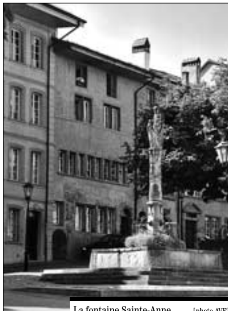
La fontaine Sainte-Anne.