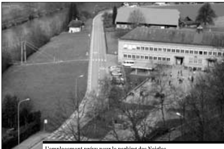
L'emplacement prévu pour le parking des Neigles.