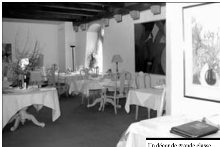
Un décor de grande classe.

bleaux d'artistes divers et la tradition veut qu'ils y laissent chacun une œuvre. Ces toiles ornent ainsi les murs de la «galerie du gastronome», partie du restaurant dont les fenêtres surplombent la Sarine et offrent une vue splendide sur la vieille-ville. Trois autres magnifiques salles sont en outre disponibles pour des banquets ou des conférences. Le restaurant et la brasserie peuvent accueillir chacun une soixantaine de personnes.