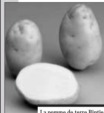
La pomme de terre Binjtje.