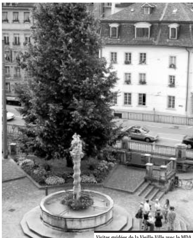
Visites guidées de la Vieille-Ville avec le MDA.

Bien qu'il soit enraciné depuis trente ans déjà, cet arbre qu'est le MDA Fribourg a donc l'intention d'étendre ses branches sur tout le canton, c'est-à-dire d'accueillir de nouveaux membres de chaque district, dans le dessein de fortifier encore et toujours notre mouve-