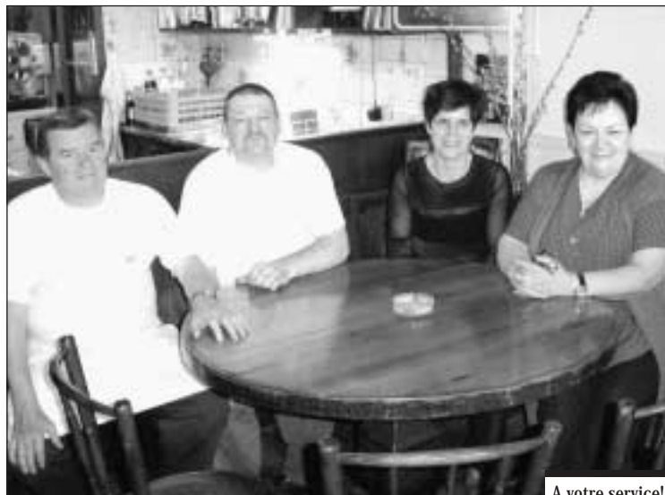
A votre service!