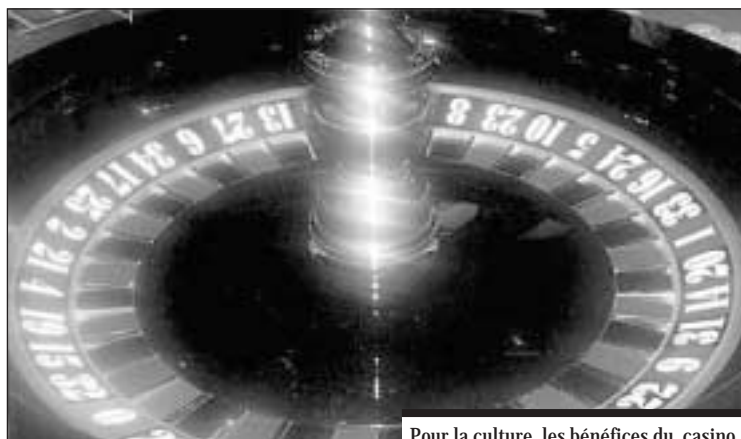
Pour la culture, les bénéfices du casino.

Appelé à ratifier les statuts de cette association intercommunale,