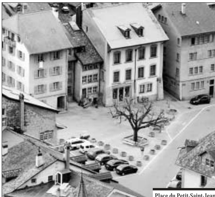
Place du Petit-Saint-Jean.