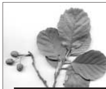
Feuilles et fruits de l'aulne glutineux.

A cette occasion furent plantés plus d'un million (!) d'arbres, dans cet Etat aux paysages dénudés. Aujourd'hui répandue sur l'ensemble du territoire, cette tradition est très suivie et médiatisée, à tel point que lorsque l'on rencontre le maire d'une grande ville, il peut arriver qu'il montre spontanément avec fierté le document qui distingue sa ville comme bienfaitrice des arbres. Beaucoup font de gros efforts pour atteindre ce but. Il a fallu 80 ans pour que l'idée des «journées de l'arbre» trouve un écho en Europe. Voici cinquante ans que la première manifestation a eu lieu en Allemagne. Il y a encore beaucoup à faire pour que la