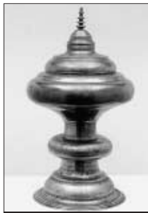
Coupe en étain d'Adam Wuilleret, 1582, n° inv. 1977-83.

Musée d'art et d'histoire (MAHF), rue de Morat 12, 1700 Fribourg. Tél. 026 305 51 40 / www.fr.ch/mahf