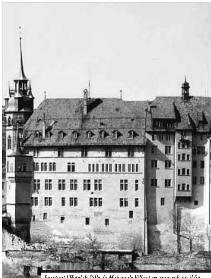
Jouxant l'Hôtel de Ville, la Maison de Ville et ses sous-sols où il fut envisagé, en 1882, d'enfermer les jeunes trublions.

Le XIX e siècle ne fut pas toujours tendre pour les enfants, c'est le moins que l'on puisse dire. Le 4 décembre 1800, la Municipalité «défend l'usage des petits traîneaux, vulgairement dit liuzes [luges], dans l'enceinte de la ville sous la peine d'un emprisonnement de deux fois 24 heures pour les grandes personnes et du fouet pour les enfants» 2 ! Comme on le voit, nos têtes blondes avaient droit à un traitement de faveur! Inversement, les parents pouvaient s'attendre à subir les foudres de l'administration communale s'ils négligeaient d'envoyer leurs enfants en classe. C'est ce qui arriva à un «étranger», notion toute relative à l'époque puisqu'il s'agit d'un artisan de la Singine: «Le Conseil informé qu'un fils du charpentier Pierre Lottaz, de Dirlaret, demeurant en cette ville s'était refusé à continuer à fréquenter les écoles, que ses parents autorisaient sa négligence coupable de se faire instruire de ses devoirs, considérant que des personnes de cette espèce sont dangereuses pour la société et qu'il