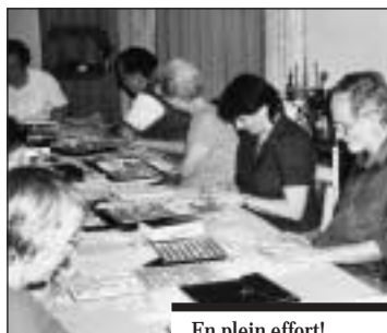
En plein effort!...