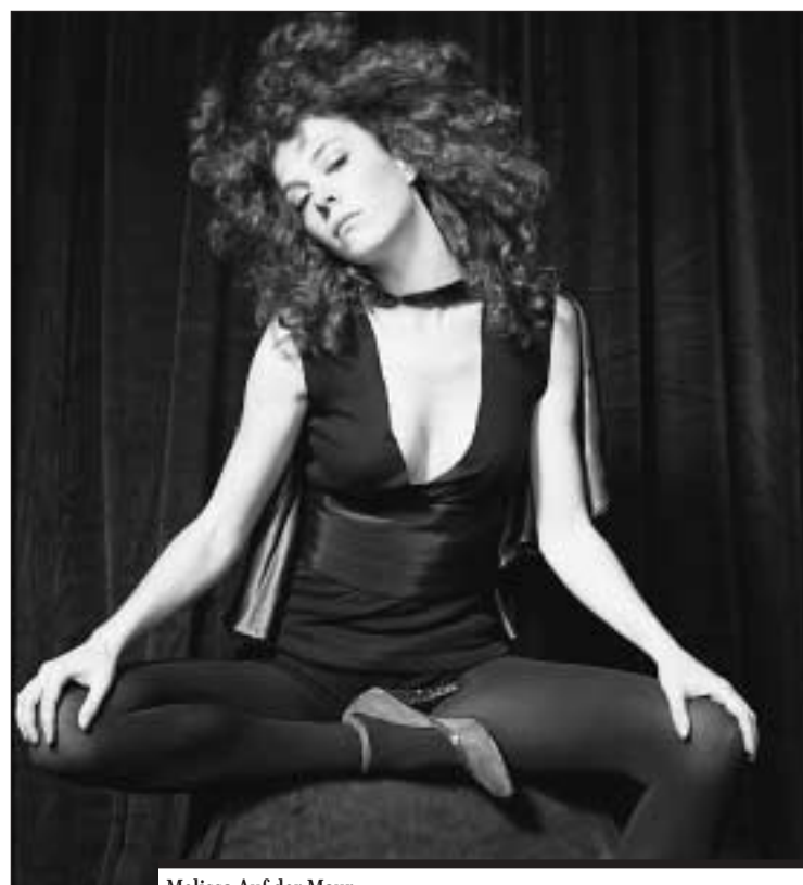
Melissa Auf der Maur.