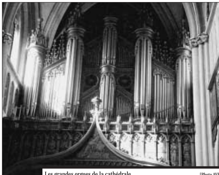
Les grandes orgues de la cathédrale.