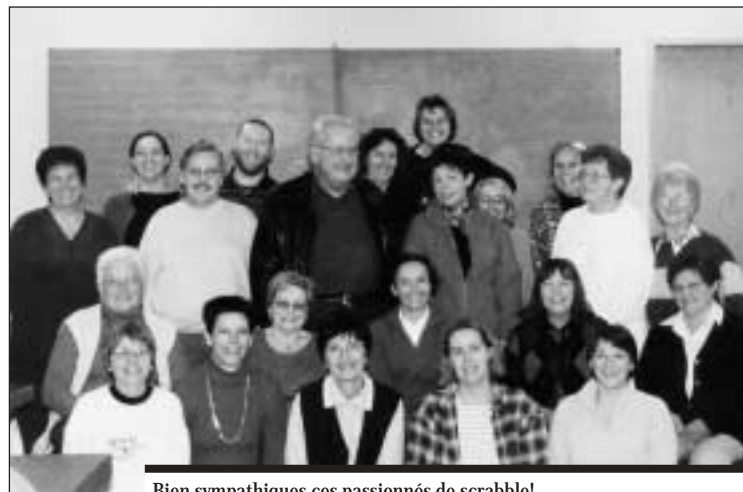
Bien sympathiques ces passionnés de scrabble!

La façon de jouer dans un club n'est pas la même que celle pratiquée en famille, mais elle est sans doute plus intéressante, car elle permet non seulement de se mesurer à son voisin, en éliminant la part de chance dans le tirage, mais elle est aussi plus enrichissante, car elle permet de progresser rapidement. Les participants jouent en duplicate , c'est-à-dire que tous les joueurs jouent avec le même jeu,