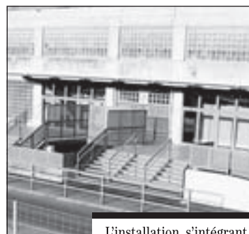
L'installation, s'intégrant très bien dans le cadre du bâtiment, prête à recevoir les spectateurs.

Cette belle réalisation sert avant tout à répondre aux normes