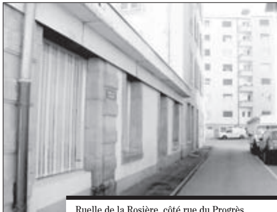
Ruelle de la Rosière, côté rue du Progrès.

Poursuivant sa promenade à la découverte de petites artères méconnues de Fribourg, 1700 visitait ce mois le quartier, autrefois ouvrier, de Beauregard. Un peu retirée, perpendiculaire à la rue du Progrès, c'est la ruelle de la Rosière qu'il fallait deviner.