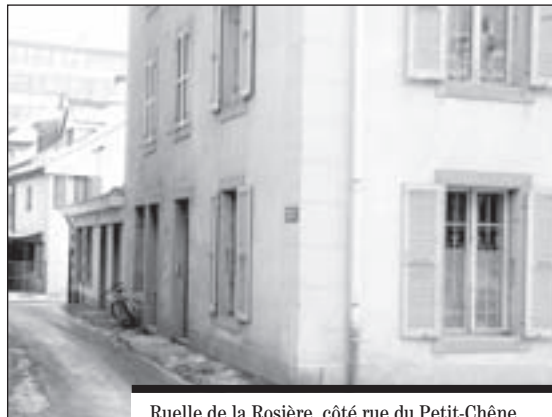
Ruelle de la Rosière, côté rue du Petit-Chêne.