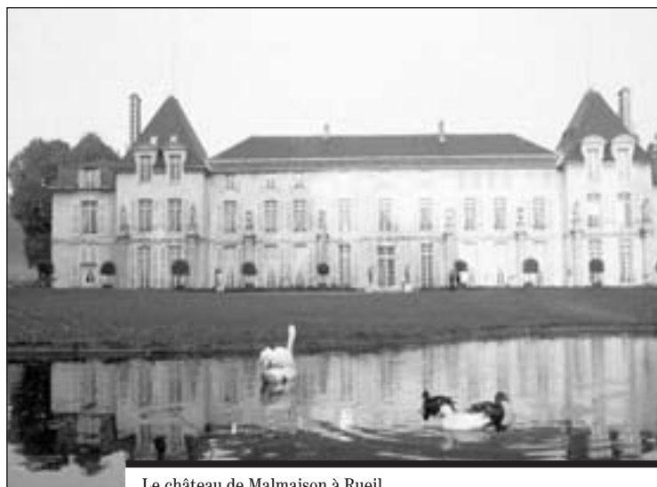
Le château de Malmaison à Rueil.