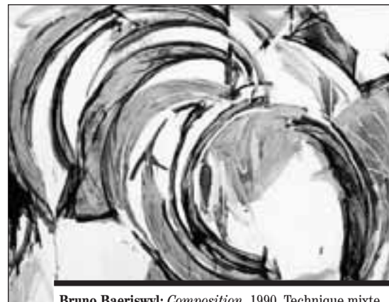
Bruno Baeriswyl: Composition , 1990. Technique mixte sur toile.

Musée d'art et d'histoire (MAHF), rue de Morat 12, 1700 Fribourg – tél. 026 305 51 40 / www.fr.ch/mahf