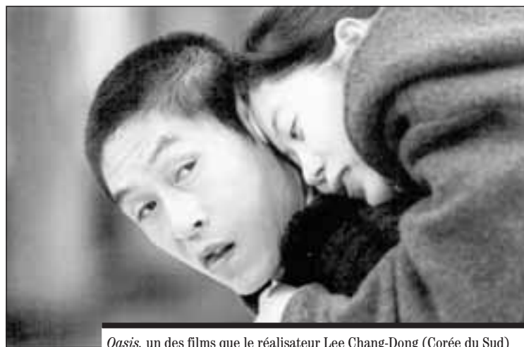
Oasis , un des films que le réalisateur Lee Chang-Dong (Corée du Sud) présentera lui-même à Fribourg dans le cadre de l'hommage que lui rend le FIFF.