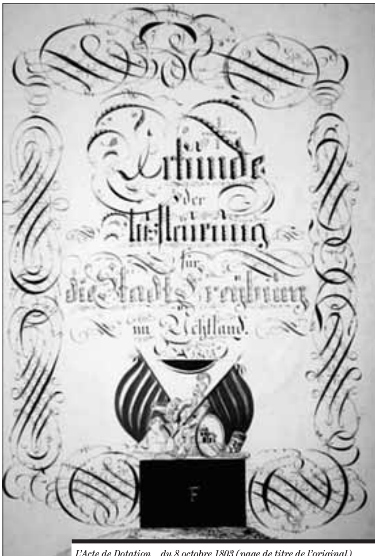
L'Acte de Dotation... du 8 octobre 1803 (page de titre de l'original) devait consacrer la séparation politico-administrative de la Ville et de l'Etat de Fribourg, source d'incompréhensions, voire de blocages.

Visiblement, les cinq rédacteurs de l'Acte de Dotation sont allés trop loin en faveur de l'Etat cantonal qui «se constitue un solide bas de laine», tandis que la Ville «est fort dépourvue lorsque de nouvelles dépenses, non prévues, sont venues» 2 . Non seulement l'Acte de Dotation ne règle pas tous les problèmes, mais, à la fois trop rigide et trop peu clair, il demeure une inépuisable source de discordes. Dès sa promulgation s'ouvre le long cycle des interprétations et des plaintes au sujet de ce document qui ne sépare pas les biens communaux et cantonaux d'une manière assez précise. Pour Jean-Pierre Dorand: «Les zones d'ombre de cet Acte de Dotation de la Ville de Fribourg sont propices à la naissance de conflits entre l'Etat et la Ville de Fribourg. Elles s'ajoutent à la tendance naturelle à la rivalité qui oppose un Etat