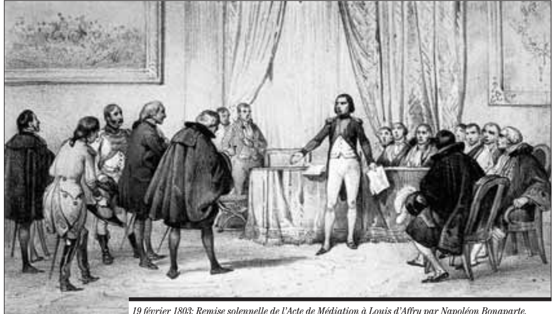
19 février 1803: Remise solennelle de l'Acte de Médiation à Louis d'Affry par Napoléon Bonaparte.