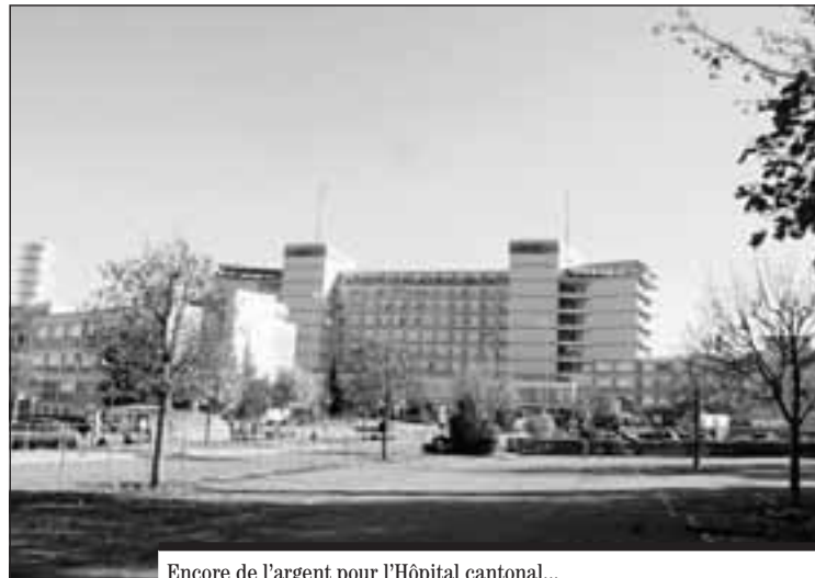
Encore de l'argent pour l'Hôpital cantonal...

Quant aux partis de gauche, ils optèrent pour une voie moyenne, celle du renvoi de l'investissement en catégorie III du budget 2008, c'est-à-dire avec présentation d'un