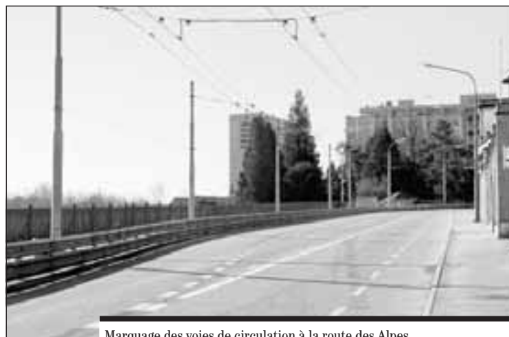
Marquage des voies de circulation à la route des Alpes.