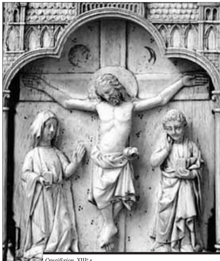
Crucifixion, XIII e s.

Les interprètes de ces joyaux de l'apogée du baroque seront les solistes, choristes et instrumentistes de la Capella concertata , sous la baguette d'Yves Corboz, directeur artistique des Concerts de la Semaine sainte de Fribourg.