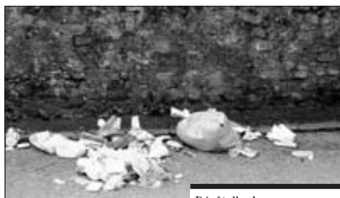
Dépôt d'ordures sauvages.

Ce sont là les principales raisons qui amènent à interdire ces pratiques et à les sanctionner.