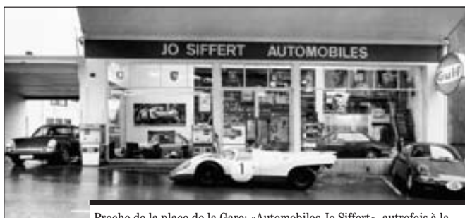
Proche de la place de la Gare: «Automobiles Jo Siffert», autrefois à la Route-Neuve.