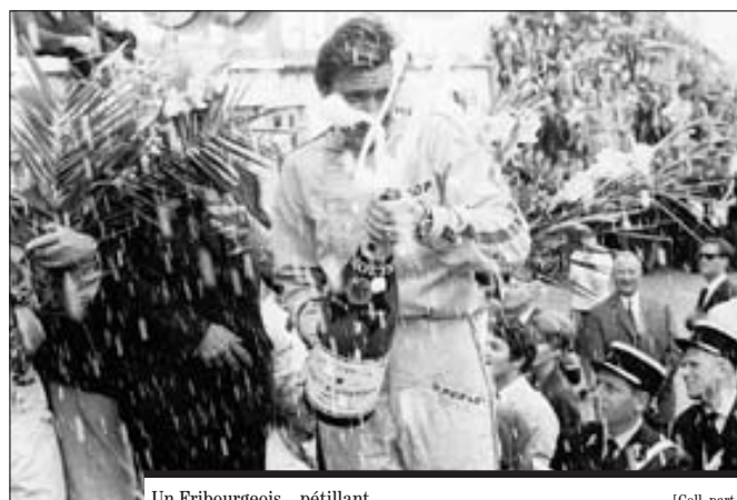
Un Fribourgeois... pétillant.