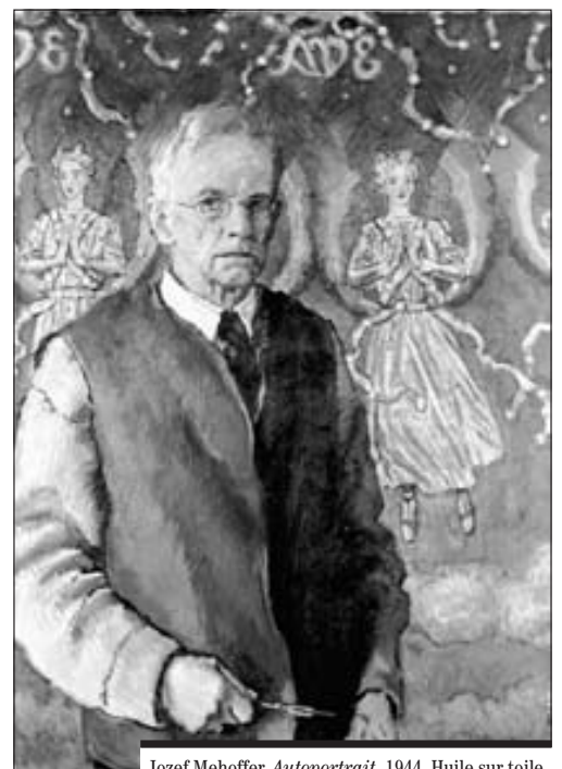
Jozef Mehoffer, Autoportrait , 1944. Huile sur toile, 97 × 68 cm.

Musée d'art et d'histoire Fribourg (MAHF), rue de Morat 12, 1700 Fribourg Tél. 026 305 51 40 / www.fr.ch/mahf