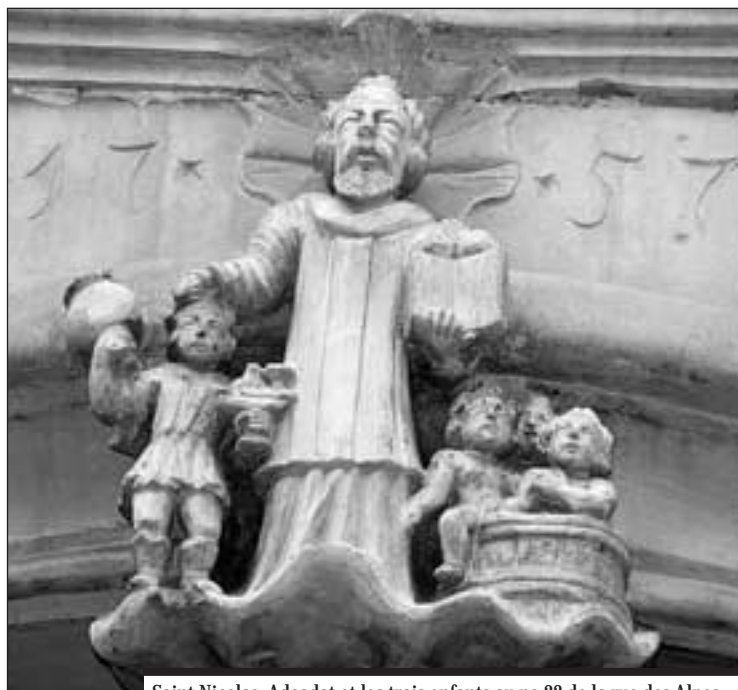
Saint Nicolas, Adeodat et les trois enfants au no 22 de la rue des Alpes

La présence de saint Nicolas au linteau de la porte du n° 22 de la rue des Alpes demeure inexpiquée. Cette maison, qui présente une belle façade Louis XV, avait-elle au XVIII e siècle un lien quelconque avec le Chapitre de Saint-Nicolas? Ou son propriétaire voulait-il simplement demander la protection spéciale du saint patron de la ville sur lui-même et sa famille? Sur le vantail de droite de la porte d'entrée sont taillées les armoiries Rosalet(?) et sur celui de gauche des armes non encore identifiées (la famille Freitag a été proposée, mais elle était déjà éteinte au milieu du XVIII e siècle). On signale par ailleurs qu'il y avait dans la maison des fragments de poêle datés 1757, aux armoiries d'Amman, autre commanditaire possible de notre groupe sculpté de saint Nicolas.