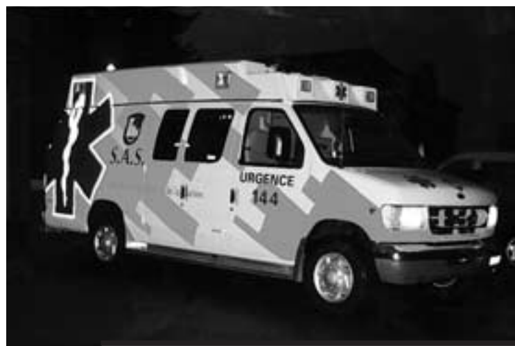
L'ambulance du S.A.S.

Appelé à approuver ces deux dépenses imprévisibles et urgentes, le Législatif l'a fait, non sans que plusieurs de ses membres interviennent pour faire part de leur étonnement quant à l'imprévisibilité de ces dépenses.