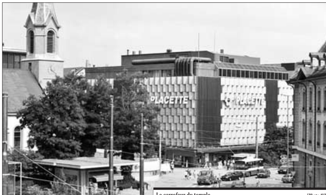
Le carrefour du temple