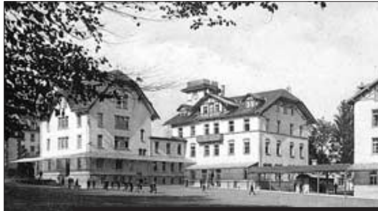
Saint-Jean ou la nostalgie de la «villa blanche», évoquée dans 'L'Aviateur' (1926) et 'Courier Sud' (1929).