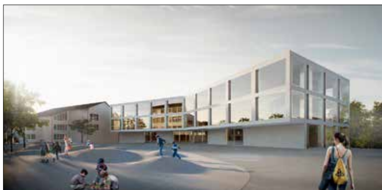
Vue du parc © Dias-Cottet Architectes/Interval Paysage