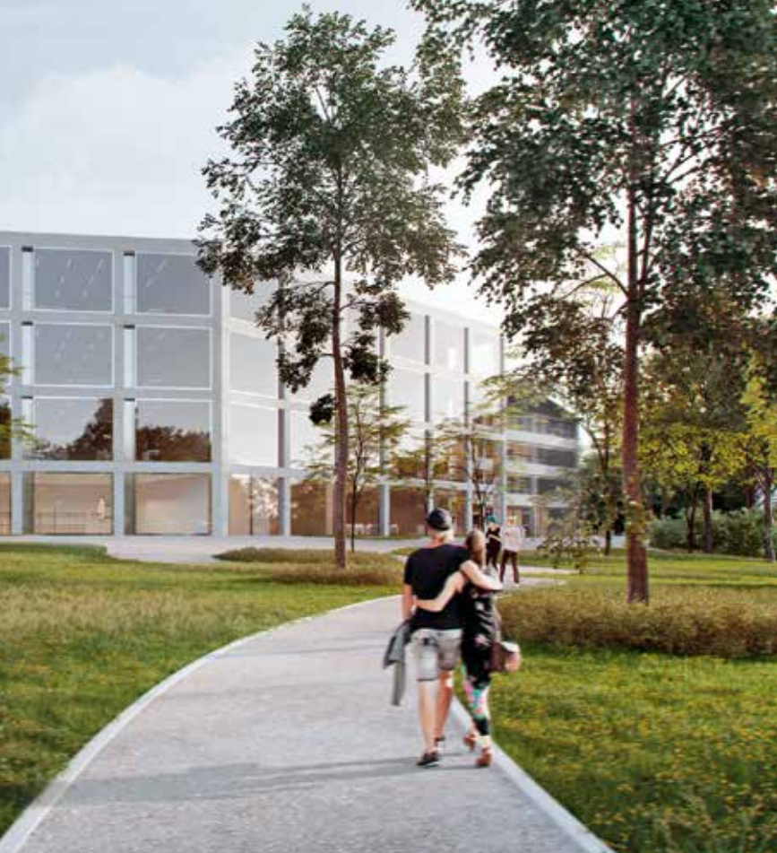
Vue de la cour © Dias-Cottet Architectes/ Interval Paysage

sont des aspects qui méritent encore d'être affinés, tant du point de vue énergétique que de l'expression de la façade. Le jury a également souligné que le principe structurel du porte-à-faux du préau couvert des deux bâtiments n'est pas résolu en l'état. Les aménagements extérieurs, avec les îlots de verdure qui viennent animer les différentes