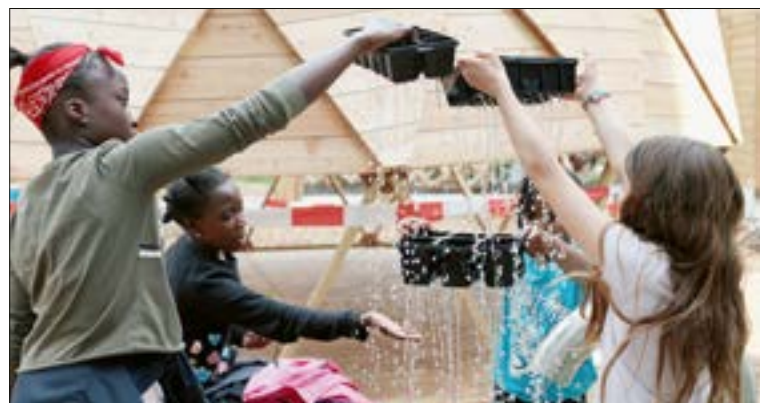
Ouvert au printemps, le jardin partagé Préfleuri est un lieu de rendez-vous des jardiniers amateurs du quartier.

Avec cette action, la Ville de Fribourg se réjouit d'avoir pu mettre sur pied une démarche réellement participative. Impliquée dans les projets de leur création à leur réalisation, les citoyennes et citoyens du quartier, quel que soit leur âge, peuvent réellement s'approprier les nouveaux espaces. Les premiers échos, notamment des utilisateurs du jardin partagé, sont très positifs. De quoi donner l'élan nécessaire à la mise sur pied de nouveaux projets participatifs ces prochaines années.