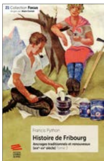
Couverture de l'ouvrage : Publicité pour la fabrique de lait condensé d'Epagny, 1925. Musée gruérien, Bulle.

Le Pays de Fribourg n'a pas encore livré tous ses secrets. Son histoire complète s'est présentée en 2018 sous la forme d'un coffret de trois volumes originaux (Ed. Livreo-Alphil, collection « Focus »). Ce 3 e tome nous plonge dans la bouleversante histoire contemporaine et nous permet de comprendre comment s'est forgé le Pays de Fribourg tel que nous le connaissons aujourd'hui. Surprenantes révélations au rendez-vous !