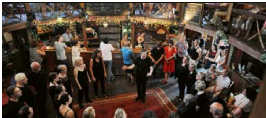
L'écran magique de la Tour Vagabonde est un lieu propice à la musique, comme ici lors de la Fête de la musique 2017.