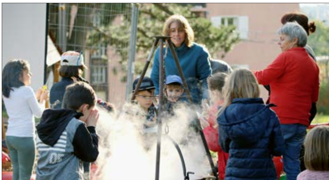
Une soupe revigorante a été concoctée au jardin partagé Préfleuri le 3 octobre.

Le projet Fribourg (ou)vert, qui sera officiellement inauguré au printemps 2020, met en avant la participation des citoyennes et des citoyens de tout âge dans le quartier du Schoenberg. La population a ainsi été impliquée de la conception du projet à sa réalisation.