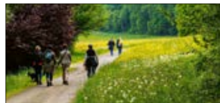
La FFR organise deux fois par année des sorties conviviales. © pixelio.de – Photo prétexte

La Fédération fribourgeoise des retraités (FFR) est forte d'environ 7200 membres, dont 668 pour la section du district de la Sarine. Reconnue par les autorités cantonales, la FFR a pour objectif de diffuser une politique favorable aux retraités et de s'engager pour la mise en place d'infrastructures et services au bénéfice des retraités. Elle propose plusieurs fois par année des activités conviviales comme des matchs aux cartes, un loto ou des repas. Vous souhaitez rejoindre la FFR ?