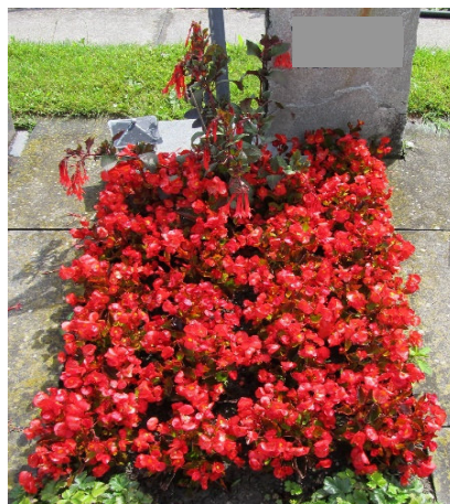
Schema 2 // Begonien, 1 Fuchsie