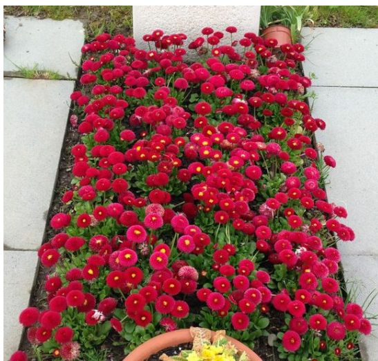
Schema 1 // Stiefmütterchen od. Gänseblümchen od. Vergissmeinnicht