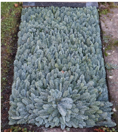
Schema 2 // Tanne blau