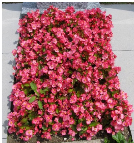
Schema 1 // Begonien