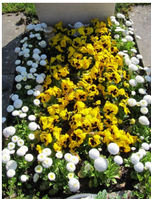
Schema 2 // Stiefmütterchen od. Gänseblümchen inkl. Kontrastbordüre