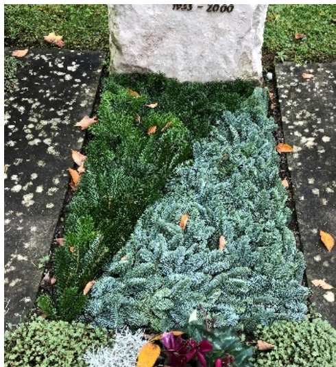
Schema 5 // Tanne grün, Tanne blau