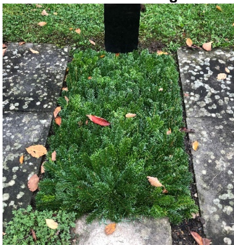
Schema 1 // Tanne grün

Allerheiligen: Ein Heidekraut ist in der Zusammensetzung jedes Schemas vorgesehen