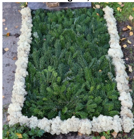
Schema 1B // Tanne grün, Moos Bordüren