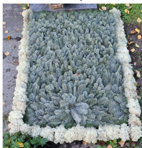
Schema 2B // Tanne blau, Moos Bordüren