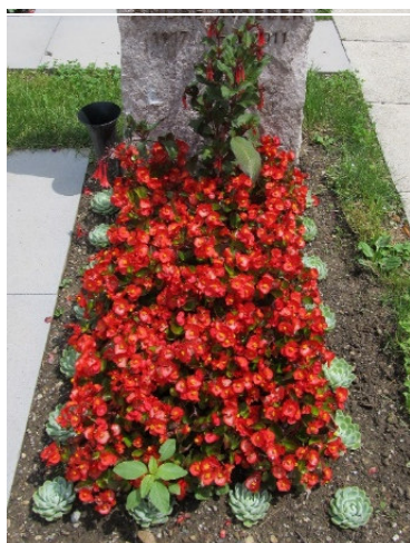
Schema 5 // Begonien, Echeverien Bordüren, 1 Fuchsie