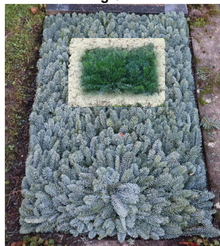
Schema 4 // Tanne blau, Moos 25 Kissen, Tanne grün