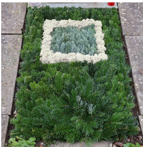
Schema 3 // Tanne grün, Moos 25 Kissen, Tanne blau