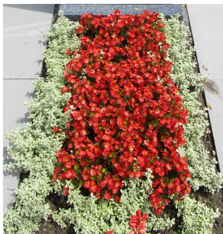
Schema 3 // Begonien, Bordüren