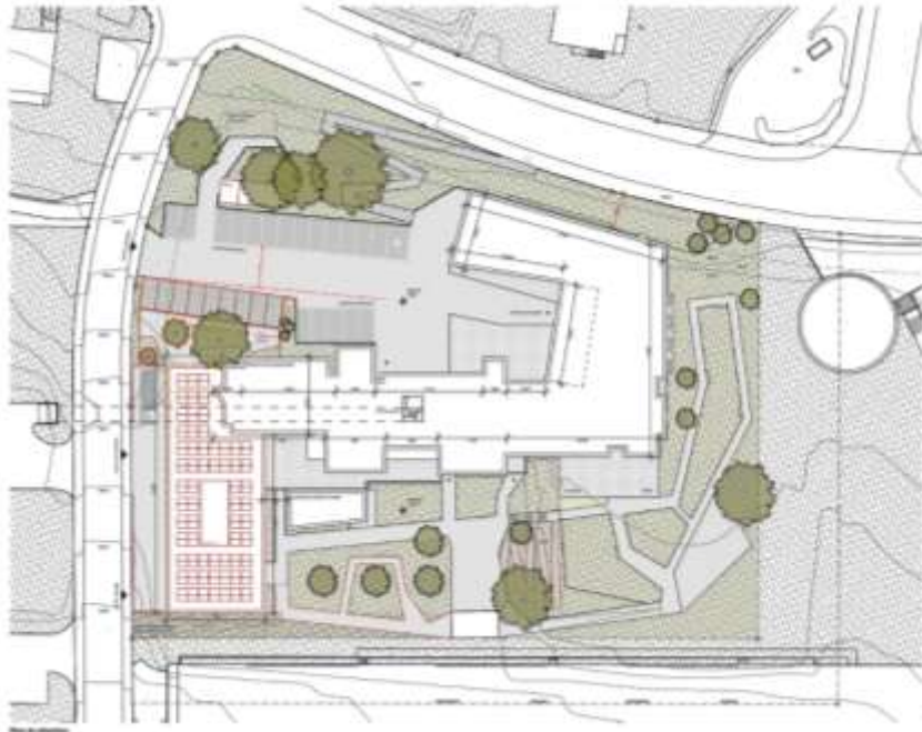
Rez de chaussée supérieur : 12 lits unité de soins