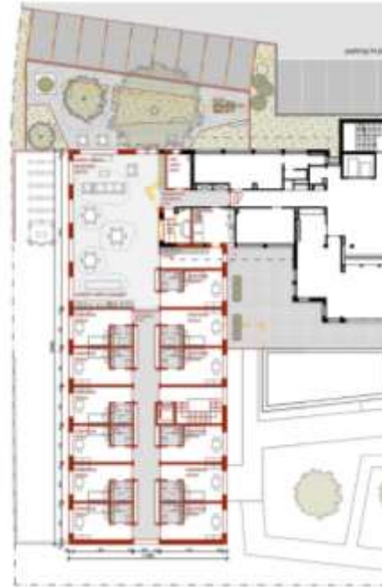
1 er étage : 12 lits en unité spécialisée en démente