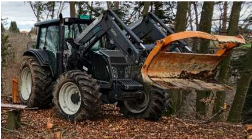
Figure 1: Valtra N143

L'entrepreneur qui prendra sa retraite en novembre 2024, envisage de vendre son entreprise de débardage. Il a proposé au service forestier de la Bourgeoisie d'acheter ledit tracteur au prix de CHF 110'000.-.