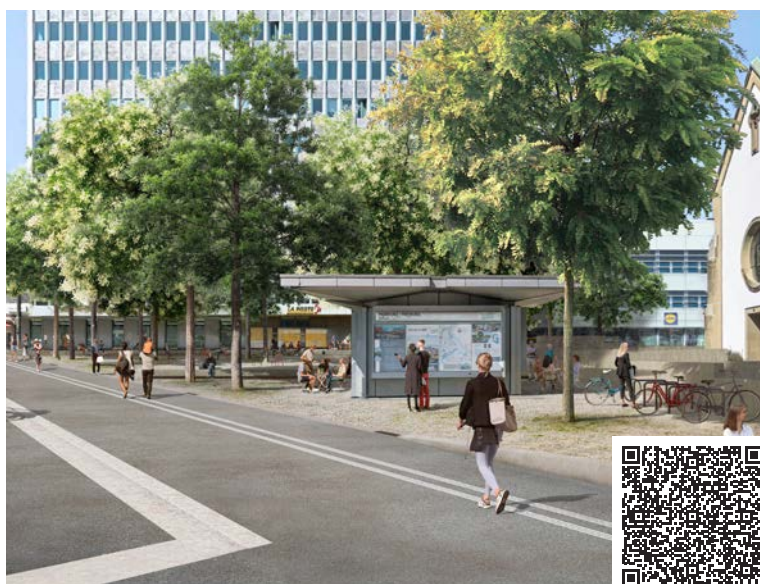
La future esplanade de la Poste, faisant la part belle à la détente et aux arbres

À l'inverse, d'autres emplacements de la ville nécessitent des interventions. À commencer par la place du Petit-Saint-Jean et le pont du Milieu. Les travaux de requalification permettront d'apaiser la circulation traversante et de rendre cet espace emblématique de l'Auge aux piétons-nés et aux activités du quartier. Le projet est basé sur les réflexions menées lors de la démarche participative et maintiendra finalement le marronnier centenaire au milieu de la place. Quant au pont du Milieu, il bénéficiera d'une cure de jouvence, comme celui de Saint-Jean récemment.