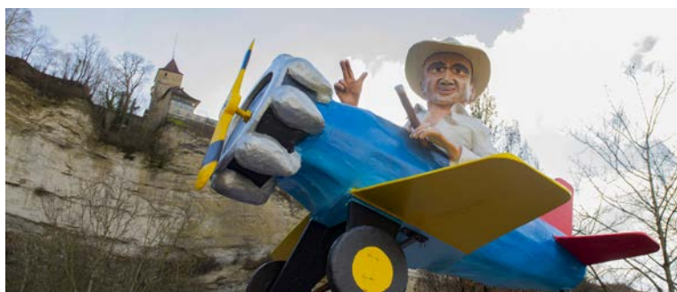
Cette année, les chars seront assurément aussi originaux qu'en 2024

CARNAVAL Le Carnaval des Bolzes va prendre possession de la Basse-Ville, et de toute la ville, du 28 février au 4 mars. Préparez vos déguisements, sortez vos confettis et pensez à acheter vos billets pour le grand cortège à l'avance, pour éviter l'attente aux caisses. Privilégiez les transports publics. Que la fête commence !