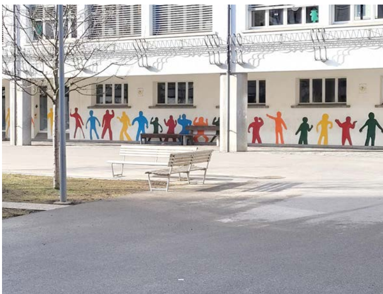
Freundschaftsbänke in der Vignettazschule

In der Rose d'Automne in Villars-sur-Glâne haben zwei Bänke ihren Platz am Rand der Pétanque-Bahn gefunden. Im vergangenen Frühjahr aufgestellt und den Bedürfnissen älterer Menschen angepasst, sind sie bei den Boule-Spielenden und ihren Angehörigen sehr beliebt, die sie nicht mehr missen wollen. Pro Senectute hat ursprünglich vier Bänke erworben und wartet nun auf die schönen Tage, um die beiden letzten zu platzieren, vermutlich unter einem Baum, um mit diesen soliden, preisgünstigen und ergonomischen Sitzgelegenheiten Begegnungsräume zu schaffen.