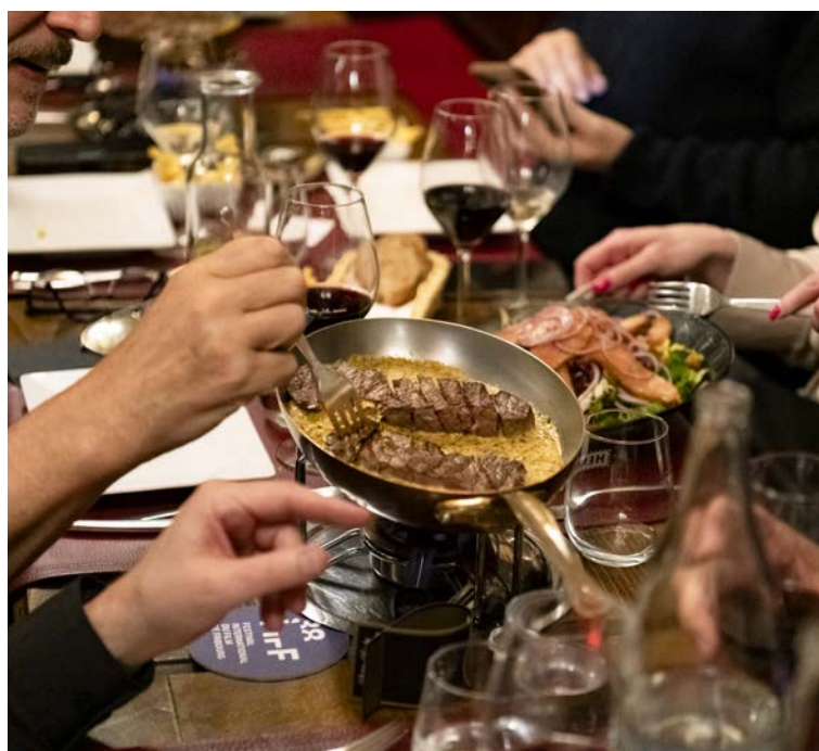
Un film, un repas à la Brasserie Le Boulevard 39 en 2024