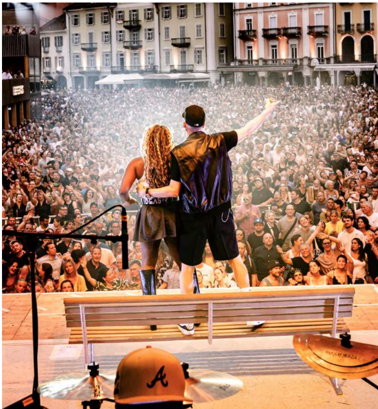
Die Bank der Stadt Freiburg mit dem Rapper Stress auf der Bühne in Locarno

Vor einem Jahr bot die Stadt Freiburg 27 alte Bänke zum Verkauf an. Alle fanden innerhalb von nur sechs Tagen Abnehmer:innen! Doch was wurde aus ihnen? Wir konnten einige Bänke wiederentdecken.