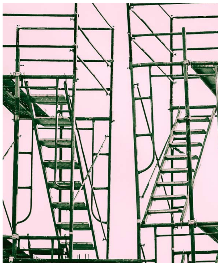
Création en cours , une exposition à voir à L'Atelier DR

Programme et inscriptions aux ateliers et tables rondes : www.ville-fribourg.ch/culture/journee-culture