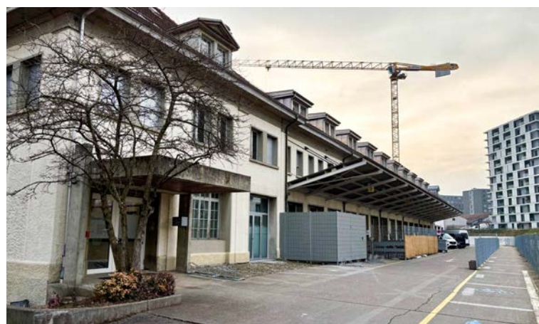
Les nouveaux locaux temporaires du Tremplin, à la route des Arsenaux

Le Tremplin organise le 22 mars prochain, de 10 à 15 heures, une journée portes ouvertes dans ses locaux provisoires, à la route des Arsenaux 16d.