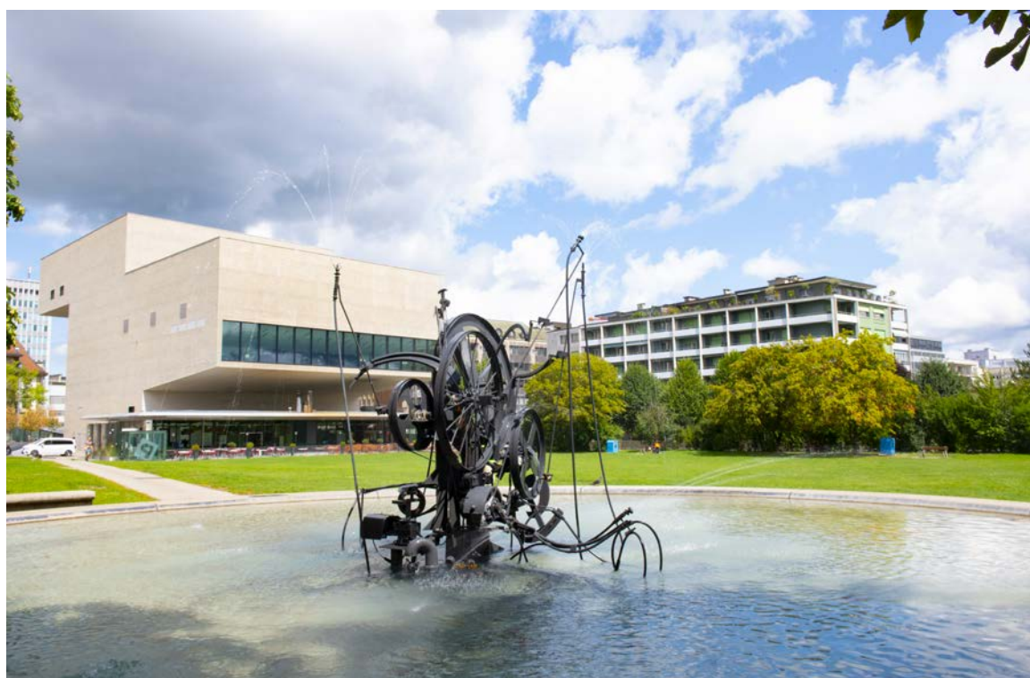
La fontaine Jo-Siffert aux Grand-Places

En 2025, Fribourg célèbre en grande pompe le centenaire de la naissance de Jean Tinguely, figure emblématique de l'art cinétique et du recyclage créatif. Cet hommage unique s'articule autour de plusieurs événements incontournables, mettant en lumière l'esprit novateur, ludique et poétique de l'artiste. Avec la Bande mécanique , le Musée d'art et d'histoire de Fribourg (MAHF) et les rues de la ville se transformeront en une scène vivante où machines et imagination s'entrelaceront. Les festivités culmineront le 15 juin avec une journée d'animations et de découvertes dans les rues de la cité. L'exposition Jean Tinguely: souvenirs d'un parcours artistique , à L'Atelier, offrira un regard intimiste sur la carrière et les influences du célèbre Fribourgeois. Une année riche en célébrations qui promet d'insuffler la magie de Tinguely à chaque coin de la ville.