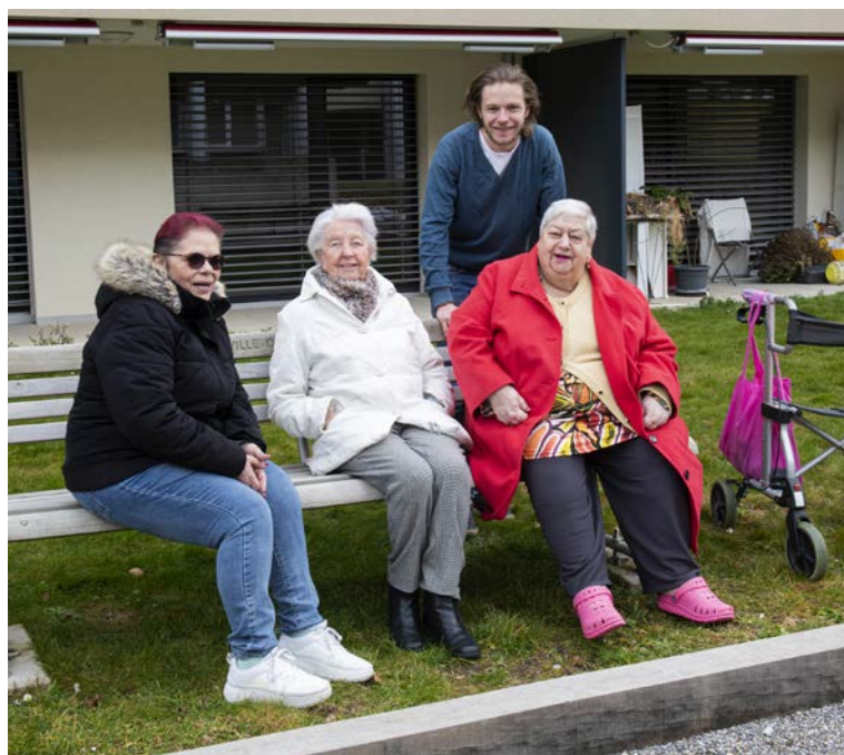
Un banc de la Ville de Fribourg spécialement adapté pour les seniors à la Rose d'Automne, à Villars-sur-Glâne