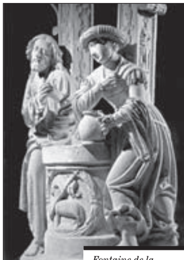
Fontaine de la Samaritaine, 1550-1551, de Hans Gieng.

Musée d'art et d'histoire (MAHF), rue de Morat 12, 1700 Fribourg. Tél. 026 305 51 40 / www.fr.ch/mahf