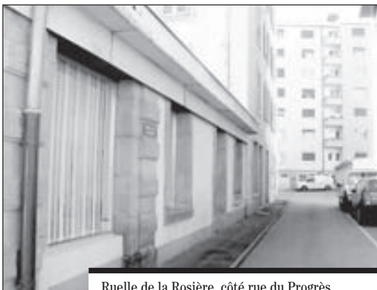
Ruelle de la Rosière, côté rue du Progrès.

Poursuivant sa promenade à la découverte de petites artères méconnues de Fribourg, 1700 visitait ce mois le quartier, autrefois ouvrier, de Beauregard. Un peu retirée, perpendiculaire à la rue du Progrès, c'est la ruelle de la Rosière qu'il fallait deviner.