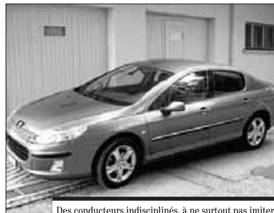
Des conducteurs indisciplinés, à ne surtout pas imiter!

sont invités à utiliser les transports publics dans toute la mesure du possible, le nombre de places de parc disponibles dans la région étant très limité.