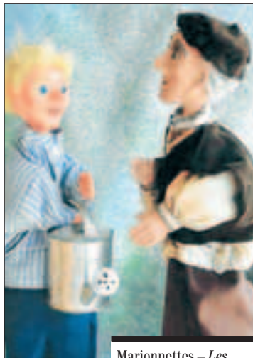
Marionnettes – Les Malheurs de Gnafron.

par les Croqu'guignols de La Chaux-de-Fonds; dès 5 ans; sa 7 (17 h) et di 8 octobre (15 h), Théâtre des Marionnettes de Fribourg, Derrière-les-Jardins 2.