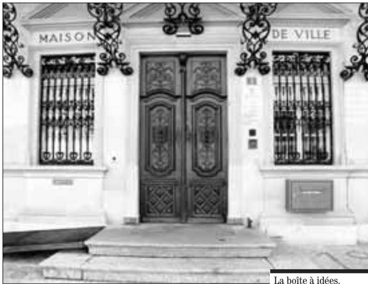
La boîte à idées.

nouvelle possibilité autour de vous. Nous attendons vos messages.