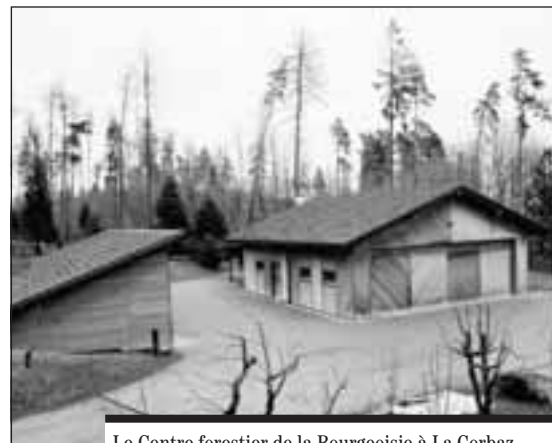
Le Centre forestier de la Bourgeoisie à La Corbaz.