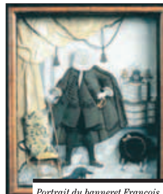
Portrait du banneret François Fivaz, 1743.

Musée d'art et d'histoire (MAHF), rue de Morat 12, 1700 Fribourg tél. 026 305 51 40 / www.fr.ch/mahf