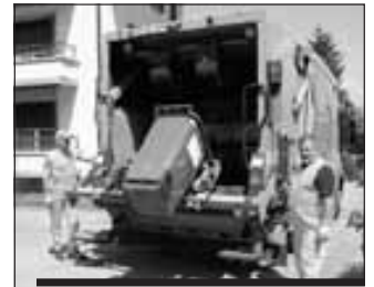
Le ramassage dans les conteneurs verts. Sammlung in Grüncontainern.