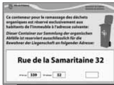
Les autocollants pour les conteneurs verts. Klebeetiketten für die Grüncontainer.