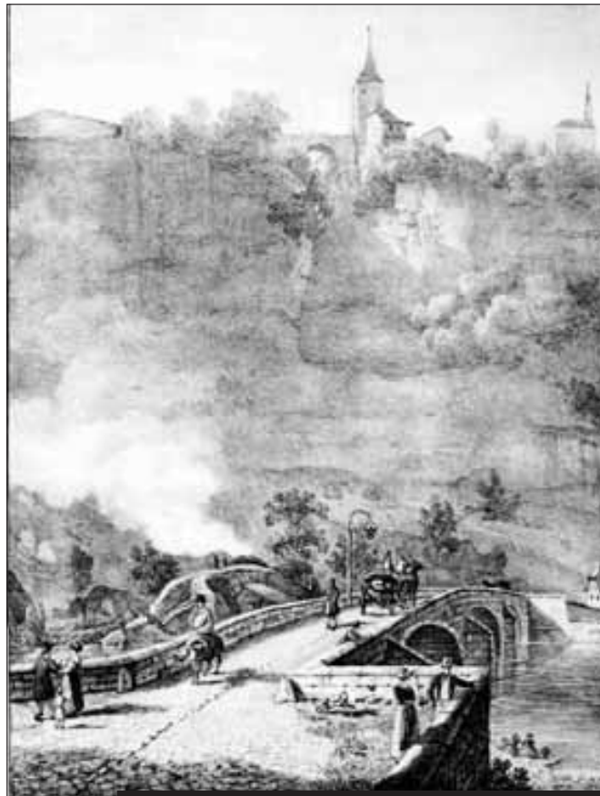
Une gravure d'époque: La Porte de Bourguillon, vue du pont du Petit-Saint-Jean (aujourd'hui pont du Milieu), par Ph. Fegely.

La décision du Directoire français d'envahir la Suisse va entraîner