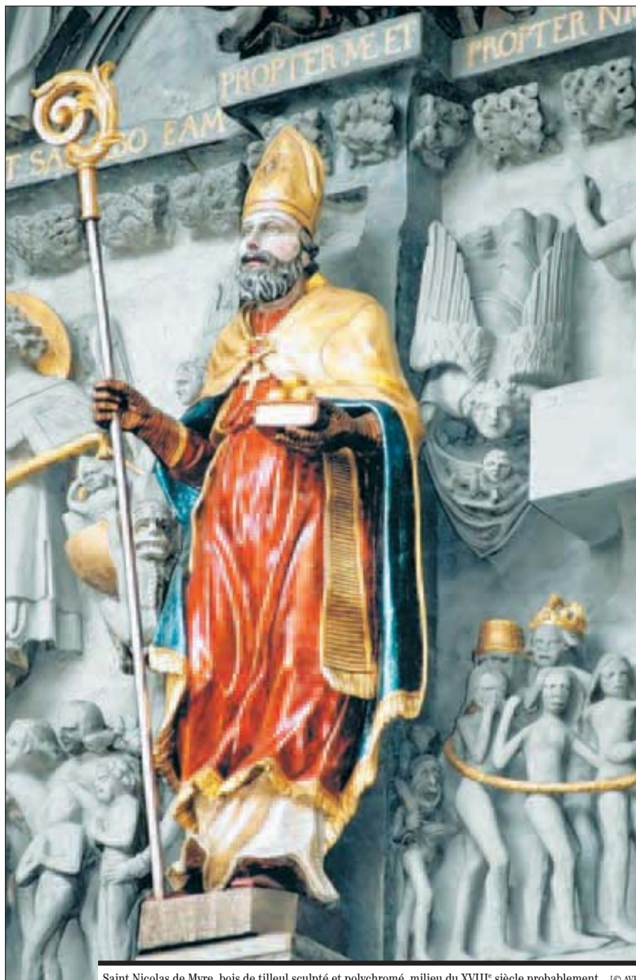
Saint Nicolas de Myre, bois de tilleul sculpté et polychromé, milieu du XVIII e siècle probablement.

Peter Kurmann et alii, La Cathédrale Saint-Nicolas de Fribourg. Miroir du gothique européen , Lausanne et Fribourg 2007.