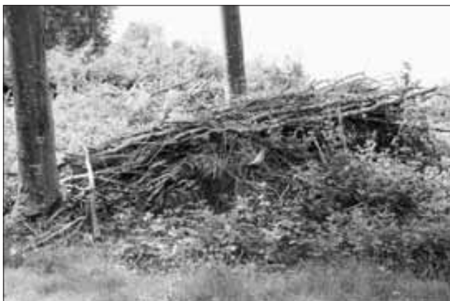
La décomposition de ce tas de bois sera favorable à la repousse de la jeune forêt.

Contrairement à certaines croyances bien ancrées, les tas de branches laissés en forêt ne contribuent pas au développement de maladies ou du bostryche. En se décomposant, ils apportent des éléments nutritifs essentiels à la forêt. De plus, ces amas de bois procurent un abri précieux pour la petite faune tels que oiseaux, hérissons, souris, ... Une multitude d'organismes (insectes, champignons, ...) participent activement au processus de décomposition du bois, ce qui permet une grande diversité écologique du milieu forestier.