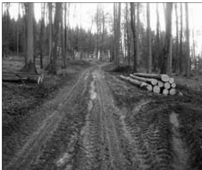
Une remise en état des chemins devra être entreprise.

Le bilan forestier est actuellement déficitaire suite aux effets de l'ouragan Lothar et aux coupes budgétaires fédérales. Le développement important de la mécanisation lourde en forêt améliore certes le bilan financier, mais n'est pas sans conséquence. Les traces laissées en forêt par ces engins, principalement sous forme d'ornières, donnent une piètre image des travaux réalisés. En exploitant lorsque les conditions météo le permettent, par temps sec ou lors de gel, les impacts sur le milieu forestier sont moins importants. Une remise en état soignée du chantier après les coupes de bois améliore sensiblement la situation. Par contre, ces travaux ou interruptions de chantiers dus à la météo engendrent des coûts supplémentaires actuellement supportés par l'entrepreneur, respectivement le propriétaire forestier. C'est le prix à payer afin de conserver la fonction d'accueil du public en forêt.