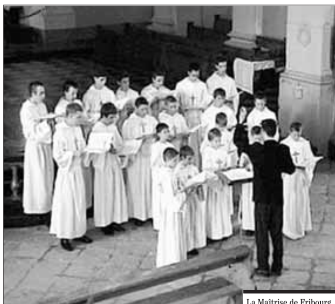
La Maîtrise de Fribourg.