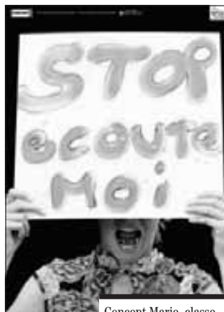
Concept Marie, classe pip Villars-Vert – Charlatan 2007.

«Stop, écoute-moi!» «Le futur c'est nous, pensez-y.» «Souris, tu dois vivre.» «Nous aussi, nous vou-