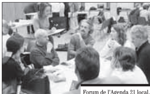
Forum de l'Agenda 21 local.

Depuis l'adoption du rapport final par le Conseil communal, en février 2005, beaucoup attendaient des nouvelles de l'Agenda 21 local de la Ville. Certains projets élaborés au sein de groupes de travail ont bel et bien été réalisés et connaissent aujourd'hui un réel succès auprès du public: la maison de la culture de l'Ancienne Gare en est un bel exemple! Un autre exemple est le projet intitulé «Promotion du vélo», actuellement en cours de réalisation, et porté par beaucoup de créativité et de dynamisme. En septembre 2007, l'aménagement d'une place de rencontre sur le site de Maggenberg, projet proposé par le groupe de travail «Espaces publics», a fait l'objet d'un processus participatif à l'occasion du pique-nique annuel du quartier (Schoenberg). En août 2008, un concours d'idées et de propositions a permis de choisir un lauréat parmi trois entreprises d'architectes paysagistes. La réalisation du projet choisi est prévue pour l'année 2009. Enfin, plusieurs propositions sont encore au stade de la réflexion et de la discussion, d'autres en cours de réalisation.