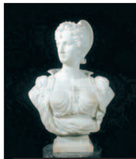
Marcello, Bianca Capello , 1863.

Musée d'art et d'histoire (MAHF), rue de Morat 12, 1700 Fribourg – tél. 026 305 51 40 / www.fr.ch/mahf