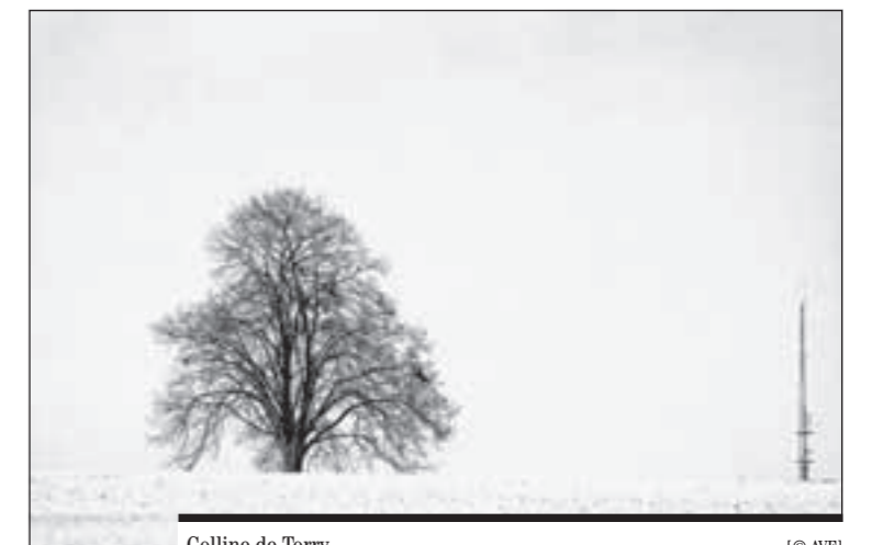
Colline de Torry.

Une réflexion devra être menée quant au devenir des espaces encore libres comme la colline de Torry, les bords de la Sarine ou encore le haut du Schoenberg, dont la planification dépasse le périmètre