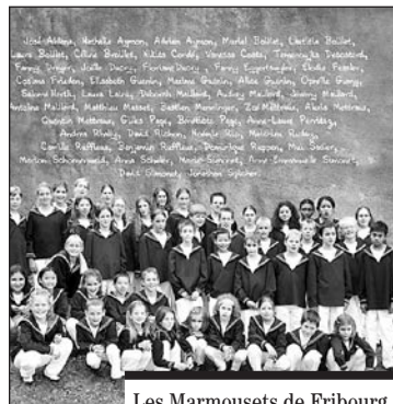
Les Marmousets de Fribourg.