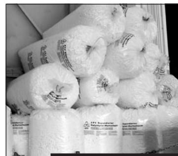
Sacs remplis de matériau recyclé PSE. Säcke gefüllt mit rezykliertem ESP.

EPS ist zu 100% rezyklierbar und sollte aus diesem Grund nicht im blauen Kehrichtsack entsorgt werden. Das Gemeindedepot Neigles gehört zu den offiziellen Sammelstellen, in denen EPS zurückgegeben werden kann. Die Stadt Freiburg hat einen speziellen Häcksler angeschafft, mit welchem die oftmals voluminösen EPS-Verpackungen zu kleinen Stücken zerhackt werden, welche die Sammelsäcke optimal füllen. Die gefüllten Säcke werden von EPS Recycling Schweiz entgegengenommen, dem offiziellen Verband, welcher für das Recycling des Werkstoffes in der Schweiz zuständig ist. Die gefüllten Säcke werden einer Produktionsfirma zugeführt, wo das Material als Rohstoff wieder in den normalen Produktionsprozess integriert werden kann. Dank dem Recycling werden so Rohstoffe in Form von Erdöl eingespart.