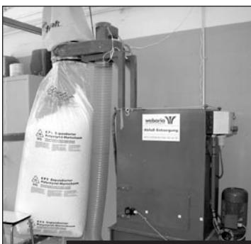
Broyeur PSE, Dépôt communal des Neigles. EPS-Häcksler, Gemeindedepot Neigles.

Le PSE est recyclable à 100% et ne doit donc pas être jeté dans les sacs-poubelle bleus. Le dépôt communal des Neigles est un point de collecte officiel des matériaux en PSE. La Ville de Fribourg a fait l'acquisition d'un broyeur spécial qui permet de réduire les emballages en PSE, souvent volumineux, en morceaux de petites tailles remplissant l'espace de manière optimale. Les sacs ainsi remplis sont repris par PSE Recycling Suisse, l'association qui est en charge du recyclage du PSE en Suisse. Les sacs sont alors acheminés vers des usines de fabrication de PSE, où les matériaux sont intégrés dans le processus de fabrication de nouveaux emballages ou panneaux d'isolation. Grâce au recyclage, on économise donc de la matière première, en l'occurrence du pétrole.