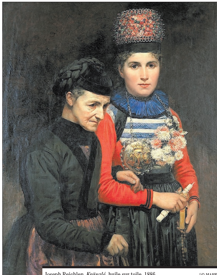
Joseph Reichlen, Kränzlé , huile sur toile, 1886.

Le Musée d'art et d'histoire de Fribourg expose différentes œuvres de l'artiste dans sa salle des combles. Parmi elles, deux fascinantes vues de Fribourg prises depuis son atelier de la rue des Alpes. Cette