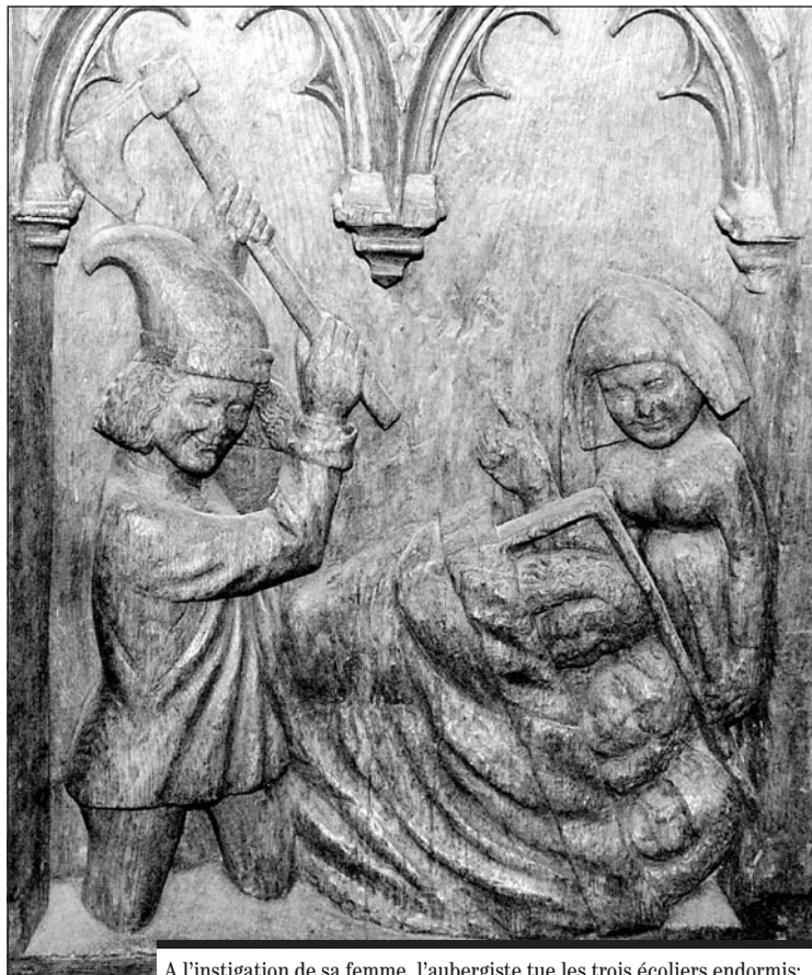
A l'instigation de sa femme, l'aubergiste tue les trois écoliers endormis; partie inférieure de la face externe de la même jouée.

De l'avis général, les deux scènes du miracle des écoliers comp-