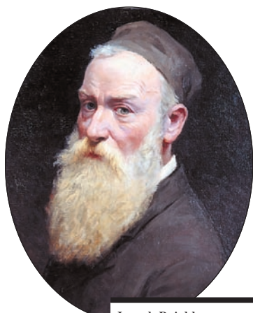
Joseph Reichlen, Autoportrait , huile sur toile, vers 1900/10.