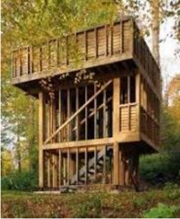
Belvedere de Hadspen House, Somerset, de David Grandorge: https://www.buildingarena.co.uk/companies/land-logic-timber/news/belvedere-at-hadspen-house-castle-cary-somerset