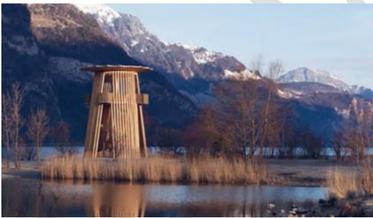
https://more-architecture.fr/tour-amikuz-2/ en Pyrénées - Atlantiques