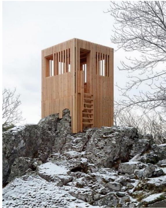
Observatoire du cerf en Corse https://www.orma-architettura.com/projets/observatoire-cerf-corse