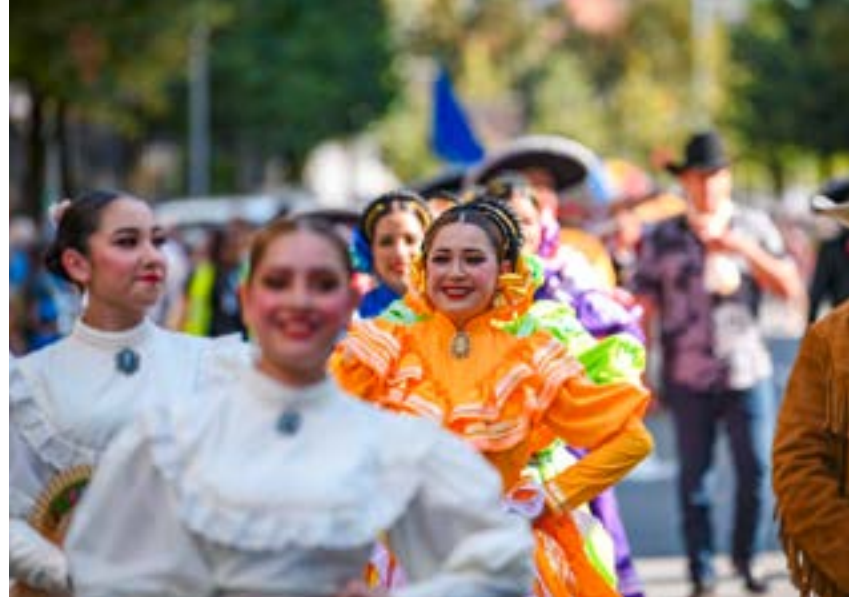
La fête promet à nouveau d'être belle.

Ouvert à toutes et à tous. Infos et inscriptions dans le courant de l'été sur www.ville-fribourg.ch/pad-torry-est