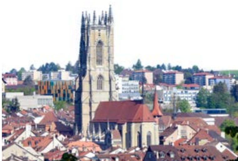
Avant d'être une cathédrale, le monument gothique était une collégiale.