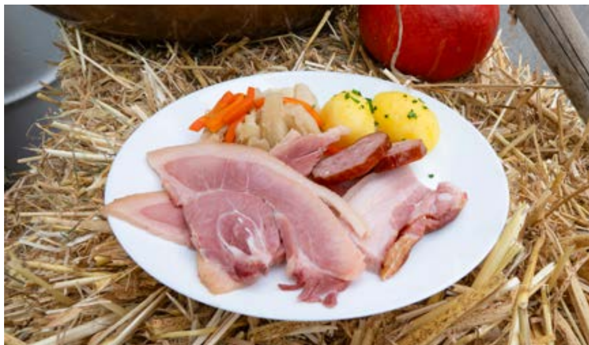
Les papilles vont à nouveau vibrer à Fribourg.

*Informations et inscriptions : fribourg.ch/fr/fribourg/benichon-sarinoise/