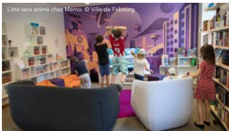
L'été sera animé chez Memo.

Du jeudi 31 juillet à 16 heures au mardi 05 août à 14 heures Du jeudi 14 août à 16 heures au mardi 19 août à 14 heures