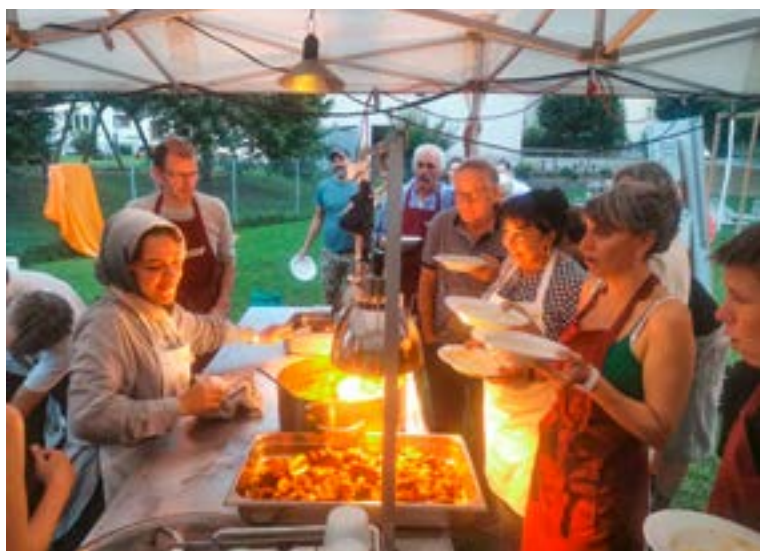
Melting popote, un beau projet qui propose de belles rencontres.

Plus d'informations et inscriptions aux ateliers de cuisine ou aux repas du soir : www.meltingpopote.ch