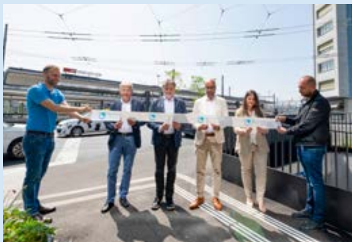
Les Autorités ont inauguré officiellement la nouvelle interface Richemond après deux ans de travaux.

Désormais pleinement achevée après la pose de la couche de roulement début mai dernier, la novatrice interface Richemond a été officiellement inaugurée le 12 juin. Un passage symbolique effectué en présence des Autorités communales et de nombreux-ses partenaires impliqués-es dans ce vaste chantier lancé au printemps 2023. La zone de rencontre faisant la jonction entre les avenues Beauregard et du Midi et la rue Louis-d'Affry a d'ores et déjà eu l'occasion de démontrer son efficacité en termes de fluidité du trafic et de sécurité des usagères et usagers, motorisés-es ou non, se sont félicités les représentants du Conseil communal et de l'Agglomération de Fribourg. Afin de permettre un accès aisé aux quais ferroviaires, grâce notamment à la proximité du nouveau passage inférieur, un nouvel arrêt de bus – logiquement baptisé « Richemond-Gare » – a été mis en service, dans les deux sens. Il remplace l'arrêt « Beauregard » en direction de la gare (l'arrêt du même nom en direction de Villars-sur-Glâne étant maintenu), ainsi que l'arrêt « Colisée », situé juste après le passage sous-voie, côté Est.