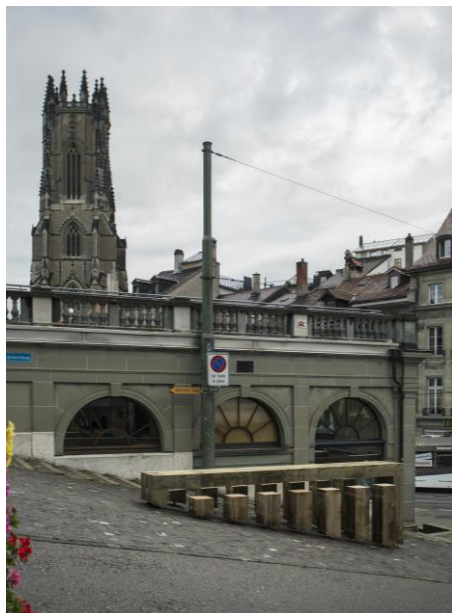
Table du Bourg