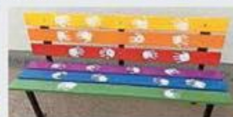
... et celui de l'école de Glovelier.

Buchs, qui a conçu et monté les bancs. Les parents ont ensuite mis la main à la pâte en peignant le bois en blanc et les armatures en noir.