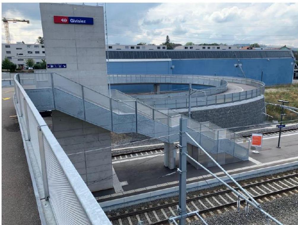
Figure 3

Exemple de passerelle à mobilité douce à Givisiez (variante "lourde"):