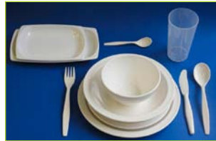
vaisselle réutilisable voir page 4-6