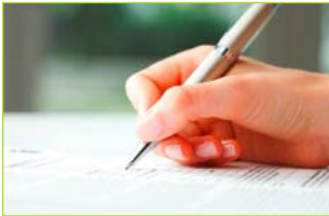
concept déchets voir page 3

"En règle générale, toute manifestation sujette à autorisation organisée sur le domaine public est soumise à l'obligation de fournir un concept sur la gestion des déchets et d'avoir recours à de la vaisselle réutilisable."